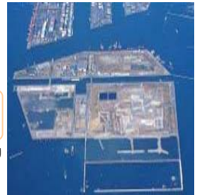
東京都新海面最終処分場